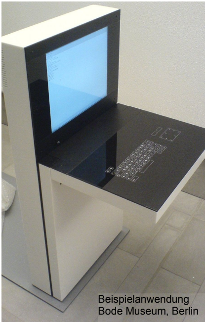
Beispielanwendung Bode Museum, Berlin

Die Tastatur ist kompakt und mit verkürztem, speziell für Internet - Anwendungen konzipiertem Layout versehen. Die Glasfläche ist kratzfest und gegen Säuren und Laugen resistent. Die Tasten reagieren auf leichte Berührung - es sind keine mechanischen Schalter vorhanden. Ausgestattet mit Touch Pad bietet diese Tastatur viele Einsatzmöglichkeiten.