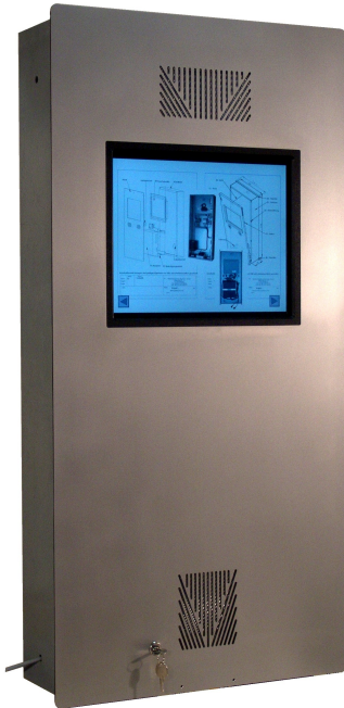
(Abb. Version 3 mit Option 17")

Wir weisen an dieser Stelle ausdrücklich darauf hin, daß sich bei in eine Wand eingebauten Monitoren - ohne geregelte Luftzufuhr und -abfuhr - aufgrund Überhitzung die Lebensdauer drastisch reduzieren kann, u.U. sogar bis zum Totalausfall. Deshalb sind unsere Gehäusesysteme speziell für diese Einsatzzwecke konstruiert. Sollte ein Be-/Entlüftung durch das Mauerwerk nicht möglich sein, haben wir dafür spezielle Lösungen (Siehe Version 2).