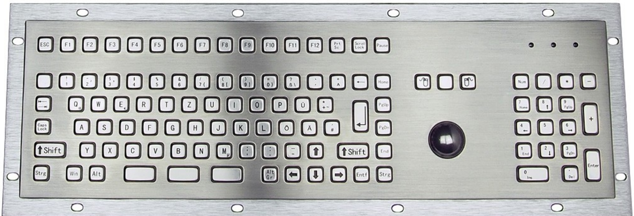
Symbol-Foto - Abbildung kann vom Original je nach Ausstattung abweichen.