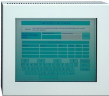
Auf-Wand-Gehäuse von vorne

Nicht in jedem Fall ist ein normaler Tischmonitor einsetzbar. Stabile Monitorgehäuse mit integriertem industrietauglichen Monitor für die Montage auf eine Wand oder an einen Schwenkarm stellen dann eine Alternative dar. Bei schwierigen Umgebungsbedingungen z.B. hohem Staubanteil, ölhaltiger Luft usw. empfiehlt sich der Einsatz eines staubdichten Gehäuses, um Abwärmeproblematiken oder Kurzschlüsse zu vermeiden. Der höhere Preis rechnet sich ganz schnell, wenn die Alternative ein Maschinenstillstand ist und damit Produktionsausfall bedeutet. Neben den Monitoren sind auch Varianten mit integrierten Mini-PC's verfügbar.