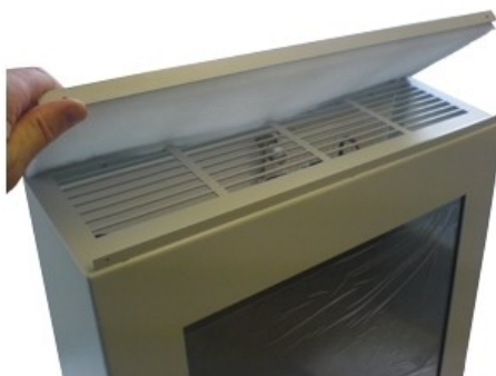
Staubdichtes Gehäuse mit von außen zugänglichen Staubfiltern