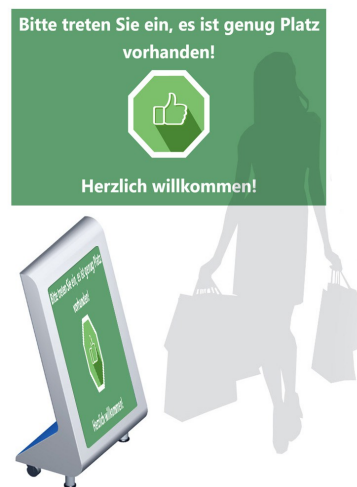
BENT-Kundenstopper mit Personenzähler